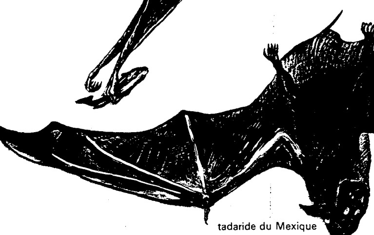
tadaride du Mexique