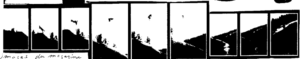
Images du magazine Snow Surf