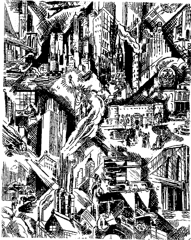
Illustration Drawn by Ruth Benson for World of Science

124. Manoir en ruine. Revue, 1917. Une des séries à thèmes commémoratives par la revue de New York. W. A. S. et al. 1917. 15 pages. Dessins de Ruth Benson et autres artistes. Les dessins sont en noir et blanc et représentent des scènes d'après la guerre.