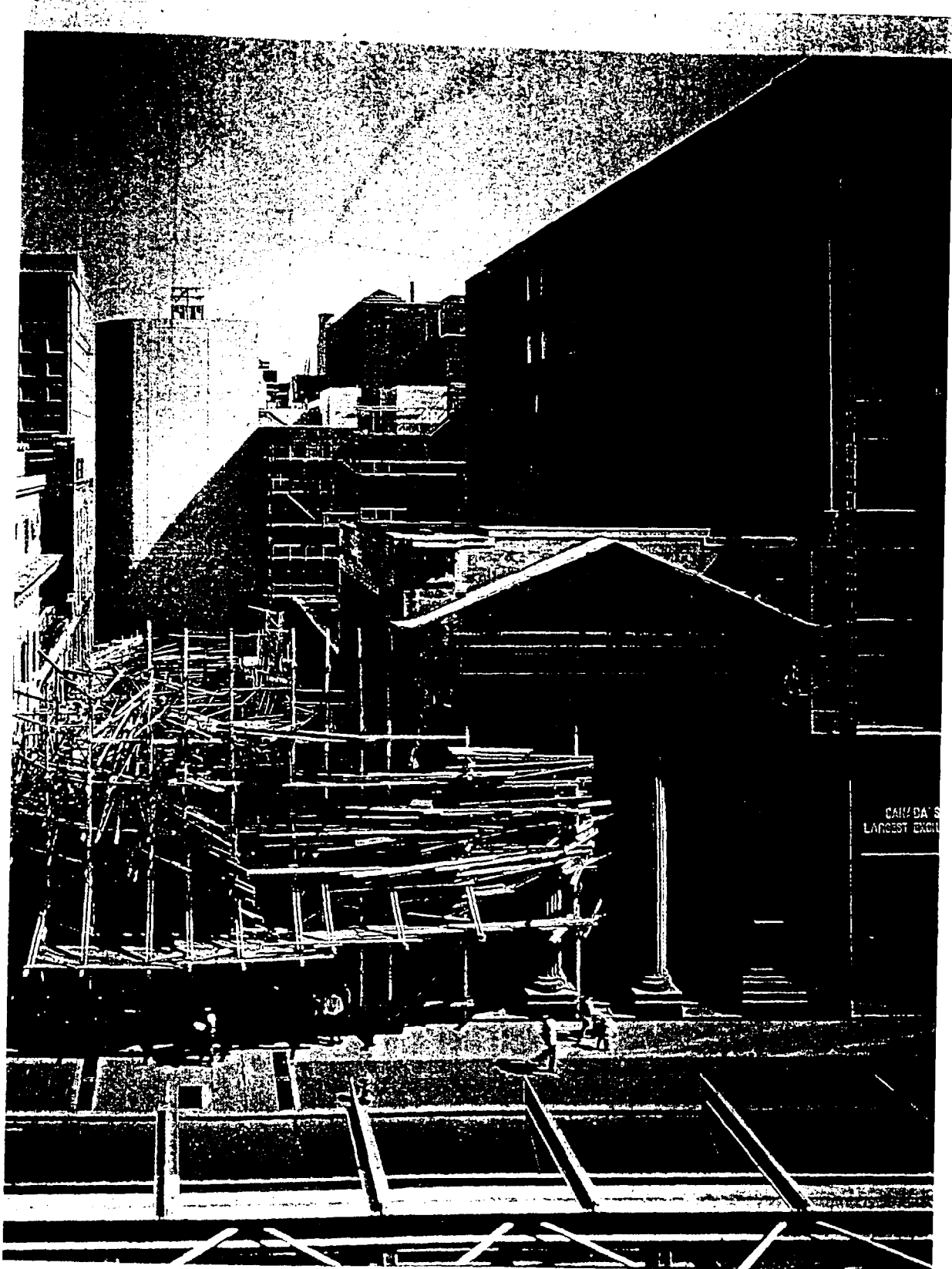
Photo de la construction de la cathédrale de la Sainte-Trinité à Montréal, 1964.