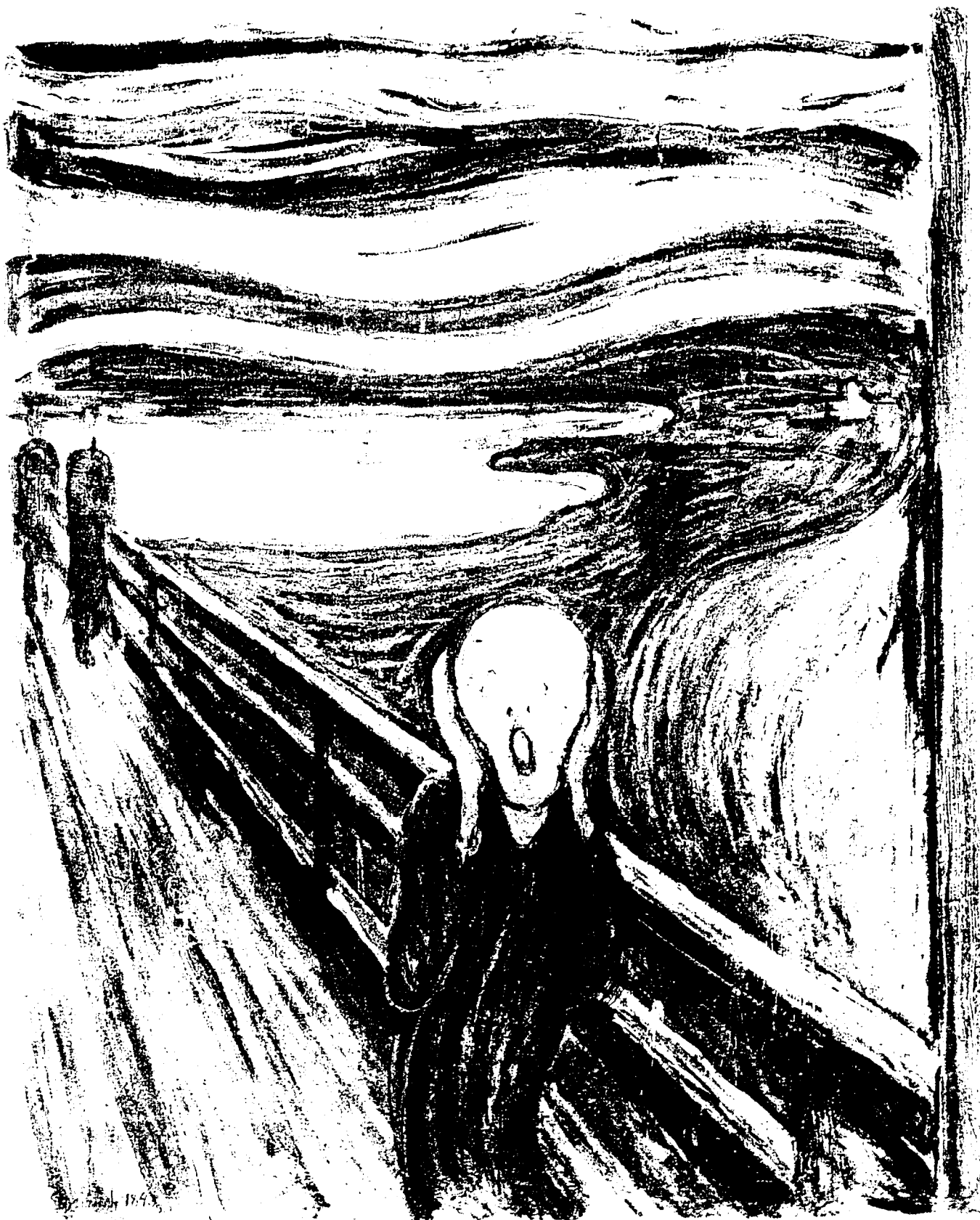
Edvard MUNCH (1863-1944), Le cri, 1893, huile et pastel sur carton, 91x74 cm