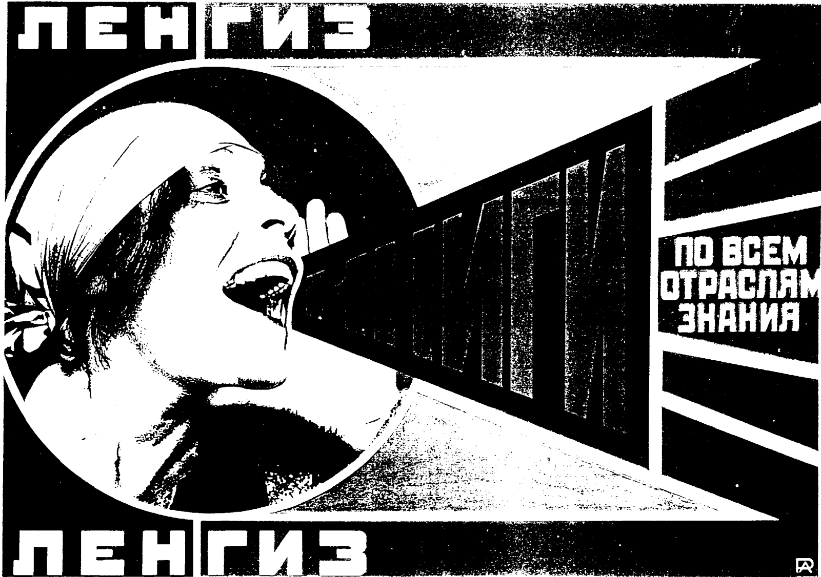
Alexandre RODTCHENKO (1891-1956), Affiche pour les éditions d'Etat de Léningrad, 1925