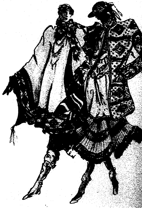
Les années 70 à 80