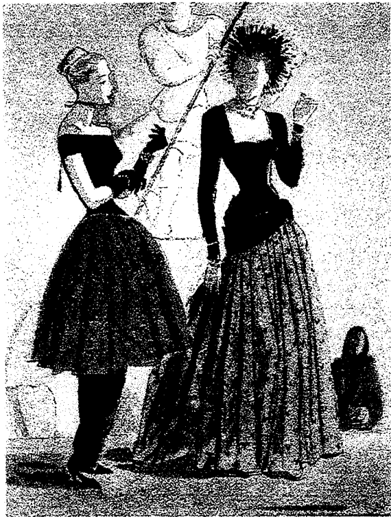
Robert Piguet, Paquin, Robes de soir, Le Femme Chic, Mars 1946