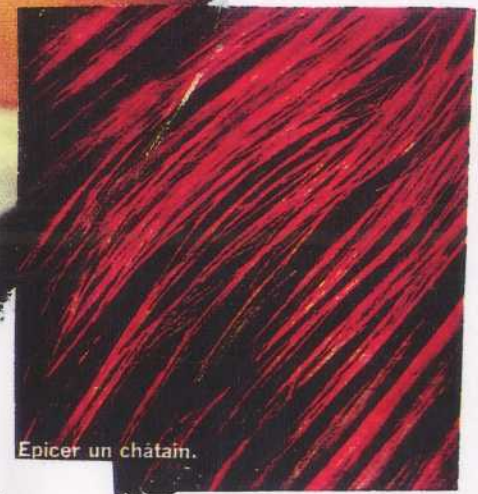
Epicer un châtain.