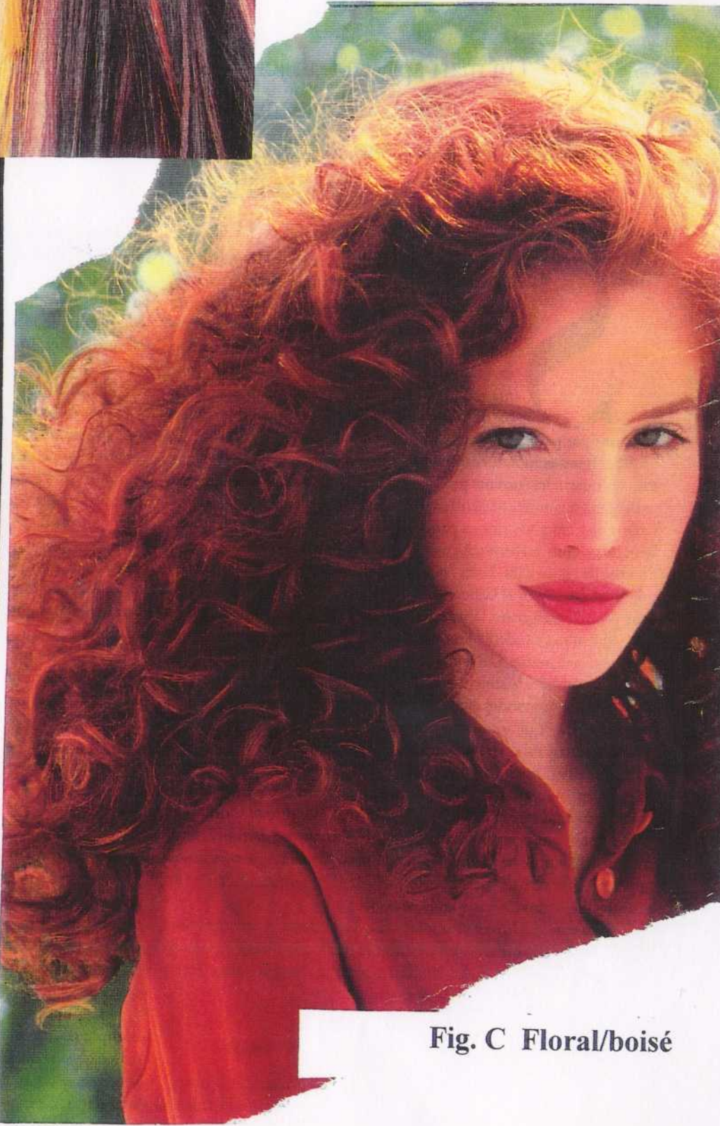
Fig. C Floral/boisé