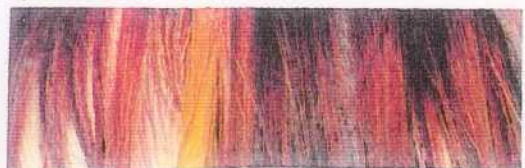
Fig. A Sauvage/frais