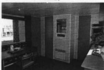
Intérieur de maisonnette

Maisonnettes O'Hara 4/6 personnes (27,3 m 2 )