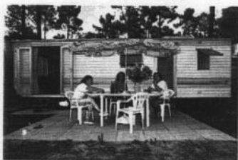
Exemple de mobilhome

Séjour avec banquette convertible pour 2 pers. Coin cuisine. 2 chambres séparées par le séjour, l'une avec 1 lit double, l'autre avec 2 lits simples. Salle de douche et WC séparés. Terrasse. Salon de jardin + parasol.