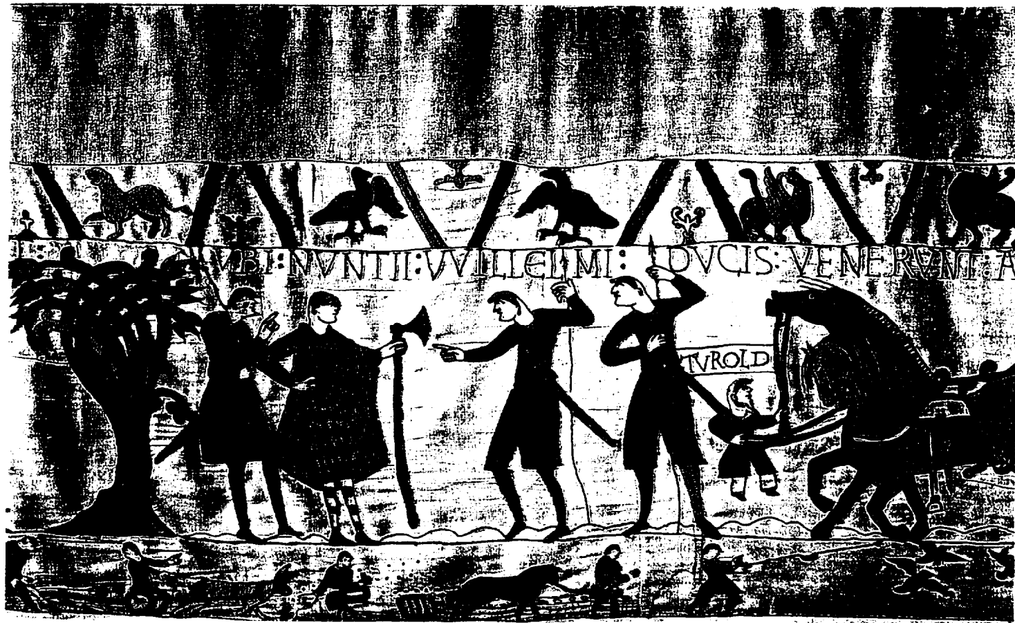
1) Scène 10 : Les envoyés de Guillaume à Gui de Ponthieu