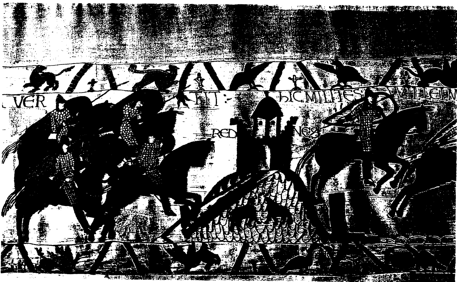
2) Scène 18 : Lors de l'expédition de Bretagne, les Normands poursuivent les Bretons jusqu'à Rennes