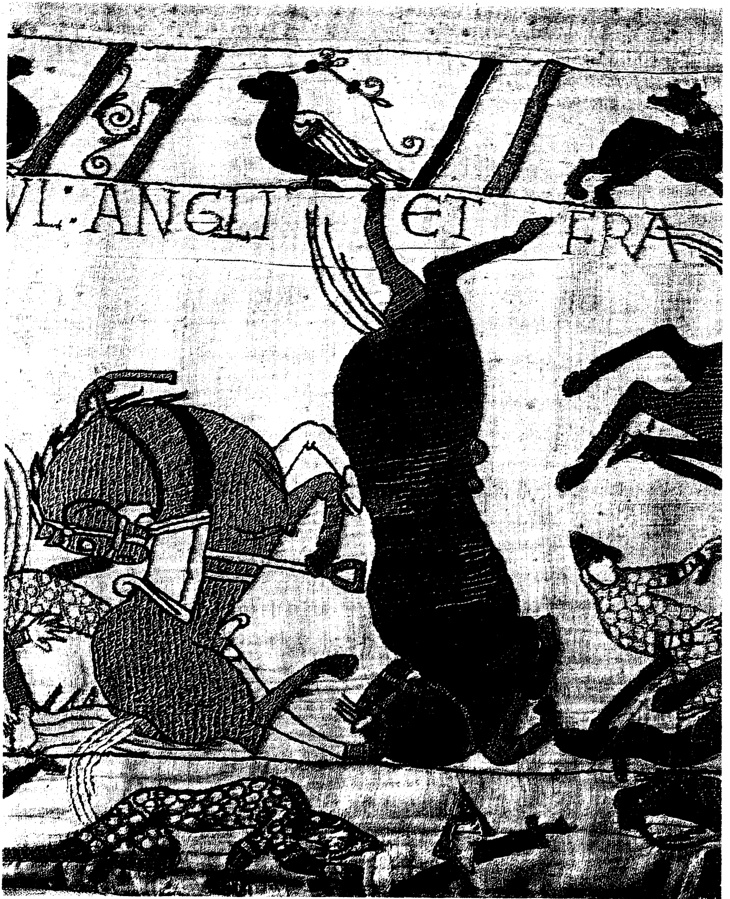
5) Gros plan sur la scène 53 : Les chevaux des Normands sont renversés lors d'un assaut