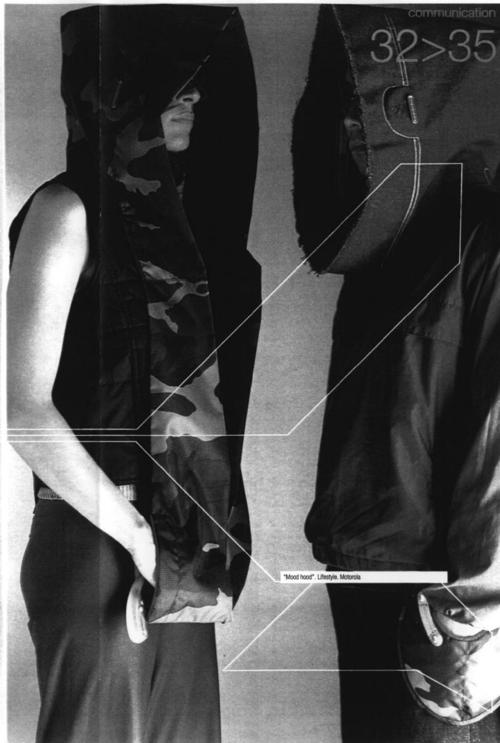
"Mood hood". Lifestyle. Motorola