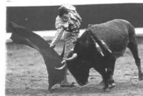
Les Arènes d'Illumbé

Un jour de régates de "traineras" (traditionnellement bateaux de pêche à la baleine), un après-midi aux courses hippiques, une visite à l' Aquarium ou à n'importe quel autre musée de la ville, ainsi que participer à un congrès quelconque peut tout aussi bien être une fête..