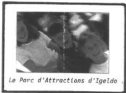
Le Parc d'Attractions d'Igeldo