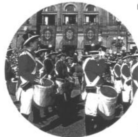
"La Tamborrada" (Le Défilé des Tambours)

ordonnance médicale, choisit San Sebastián pour prendre des bains de mer. À la suite de la reine, noblesse et bourgeoisie se rendirent à la "Bella Easo" à la recherche de sa bonté climatique et de ses eaux salubres déjà célèbres.