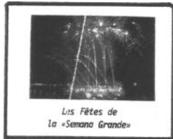
Les Fêtes de la «Semana Grande»