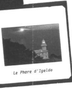
Le Phare d'Igeldo