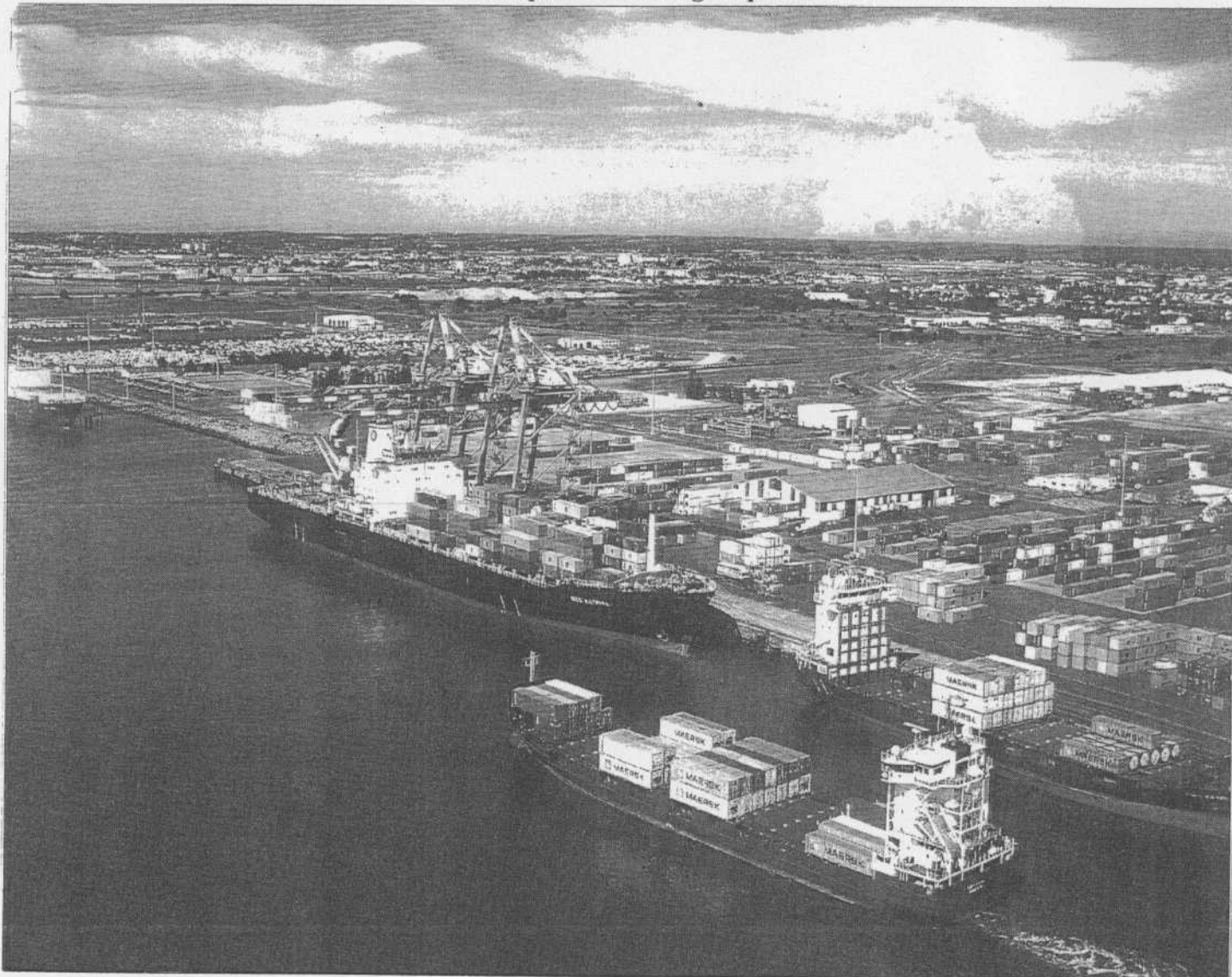
Documentation Port Atlantique Nantes Saint-Nazaire

* Une plate-forme logistique est un espace utilisé pour l'organisation des transports. Cette plate-forme s'appelle multimodale quand elle associe plusieurs modes de transport différents.