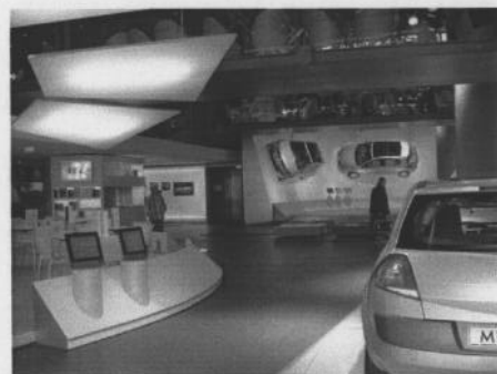
Série de vues latérales à gauche, partant de l'entrée.