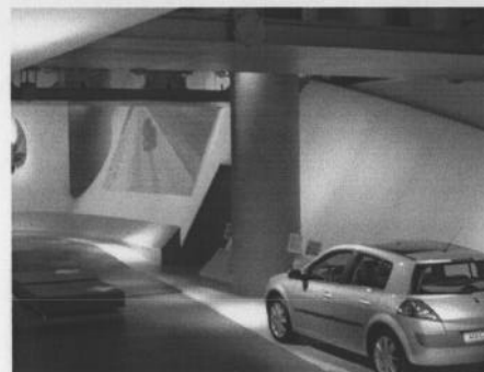
Vues latérales à droite, partant de l'entrée.