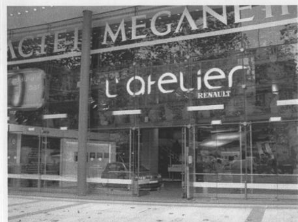
Façade Champs Élysées.