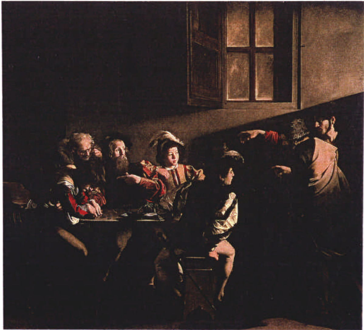
1) LE CARAVAGE 1573 – 1610 La vocation de Saint Matthieu Église Saint-Louis des Français à Rome 340 cm x 322 cm