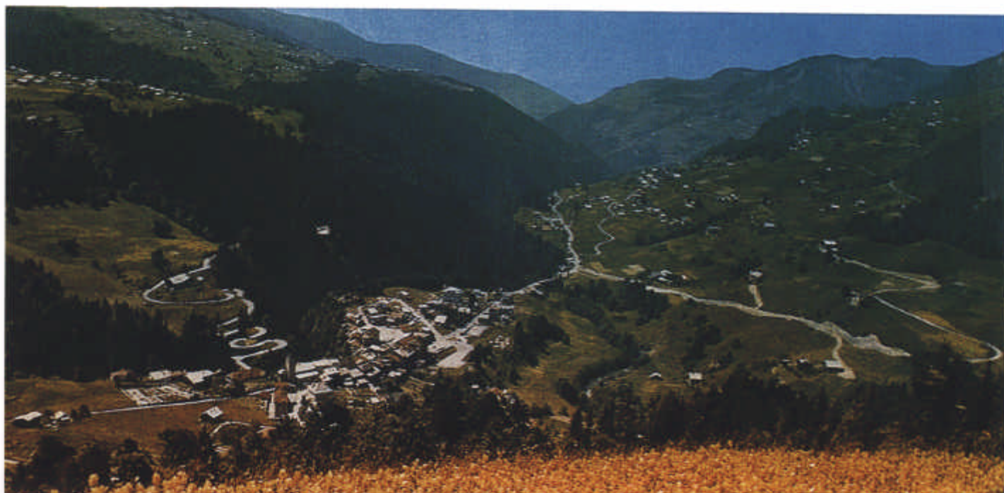
La vallée de l'Arly, en aval de Flumet