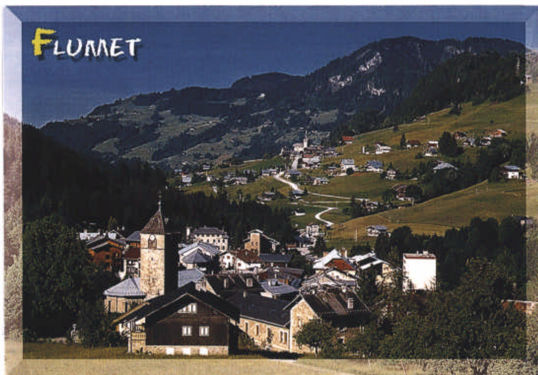
Flumet au premier plan, et St-Nicolas-la-Chapelle au fond