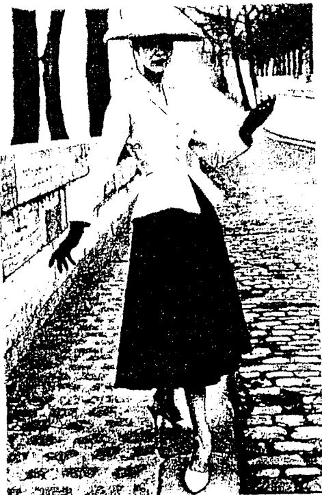
Christian Dior, tailleur «Bar», ligne «corolle», 1947. Dior lance le «new-look», qui remporte un succès de scandale immédiat : nouvelle longueur, nouvelle silhouette très féminine.