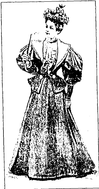
Robe tailleur. «La Mode pratique», 1895, n° 33.