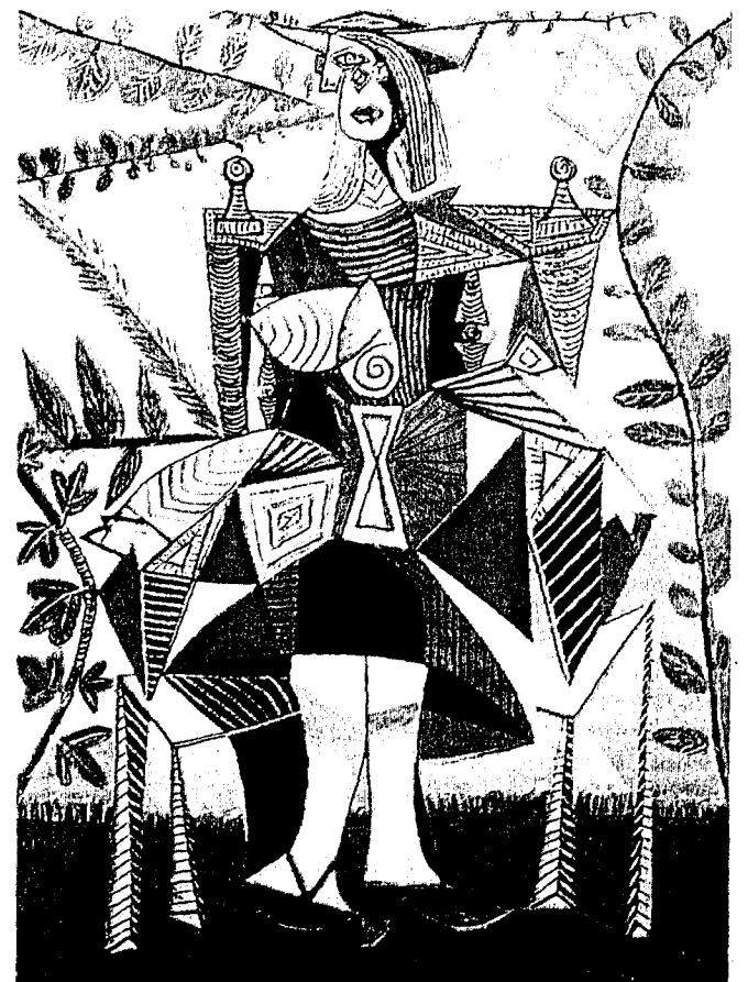
PABLO PICASSO "Femme assise dans un jardin" 1938.