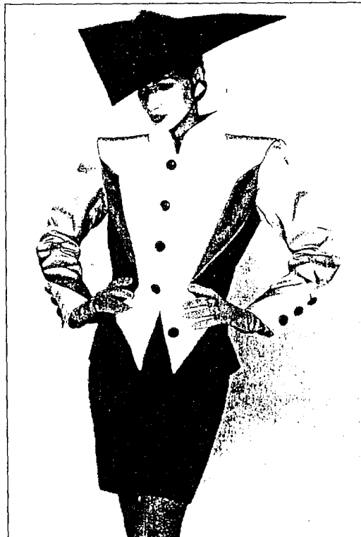
Saint Laurent Rive gauche, ensemble, 1988-1989. Paris, musée de la Mode et du Textile, collection U.F.A.C.