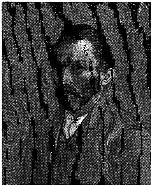
Autoportrait de Van Gogh Peinture, 1889

Voici deux images qui semblent proches et différentes à la fois. On vous demande de compléter le tableau du folio 2/5 en vous appuyant sur vos connaissances artistiques et techniques afin de mettre en évidence les similitudes et les différences entre ces deux documents.