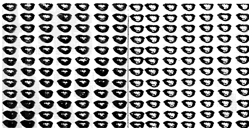
Andy Warhol, Les lèvres de Marilyn Monroe , 1962 Deux panneaux : 210,2 x 205,1 cm et 211,8 x 210,8 cm

6 – Quelles interventions Andy Warhol fait-il à partir de la photographie de Philippe Halsman ?