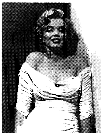
Philippe Halsman Marilyn Monroe , Life , 7 avril 1961