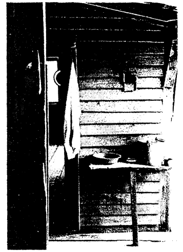
Walker Evans, Cuisine des Burroughs , Hale County, Alabama, 1936

8 – Une importante commande du gouvernement américain fut passée à onze photographes dans les années trente dont Walker Evans. Quel était le but de ce projet ?