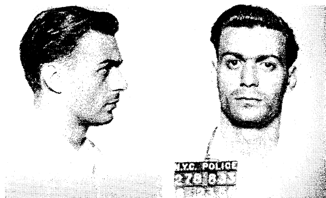
Andy Warhol, Homme recherché n°10 (Louis M), 1963 Deux panneaux de 122x100 cm chacun

1 – A quel genre photographique appartient cette image d'Eugène Bertillon ?