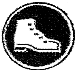
Port de chaussures de sécurité