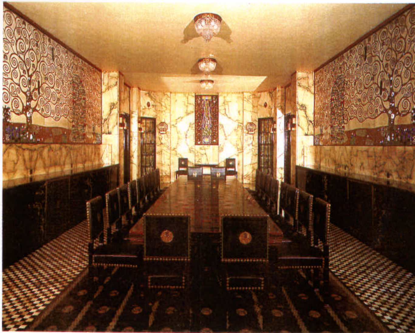
Josef HOFFMANN, palais Stoclet, Bruxelles, 1905-1911, salle à manger, mosaïques de Gustav KLIMT.