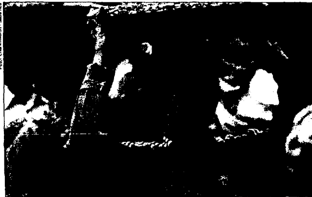
Construction d'un hôtel. Le travail des enfants reste courant au Myanmar, sans que cela émeuve trop les pays du Nord.

Le travail forcé et le travail des enfants sont toujours régulièrement pratiqués au Myanmar (ex-Birmanie), rappelle la Confédération internationale des syndicats libres (CISL), dans un rapport de février 2001. Particulièrement concernées, les minorités Môn, Karen et Shan, résidant au centre et au sud du pays. La résolution votée par l'Organisation internationale du travail (OIT) en novembre dernier à l'encontre du Myanmar, l'un de ses membres, pour non-respect de l'article 29 de sa charte sur le travail forcé a eu peu d'effets pour l'instant.