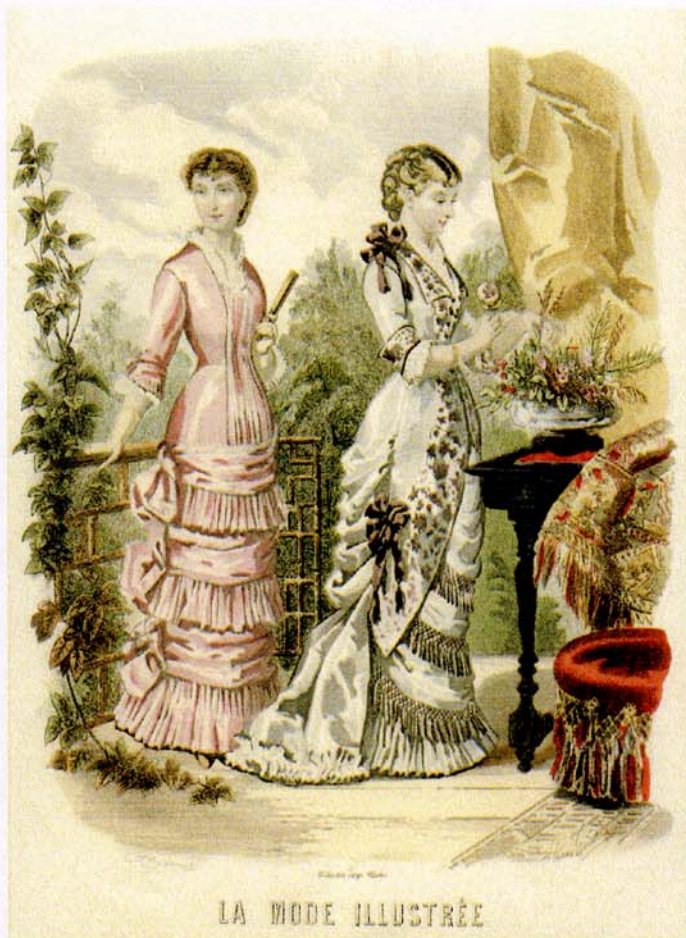
7 novembre 1880