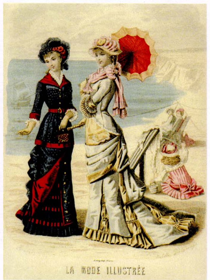
11 juillet 1880