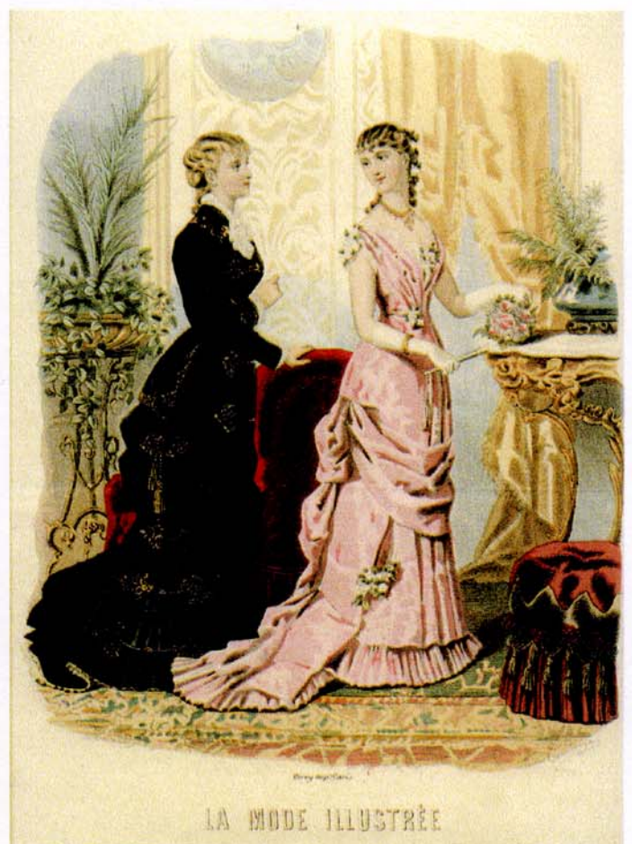
26 décembre 1880