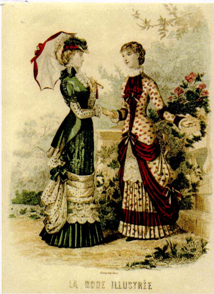
16 mai 1880