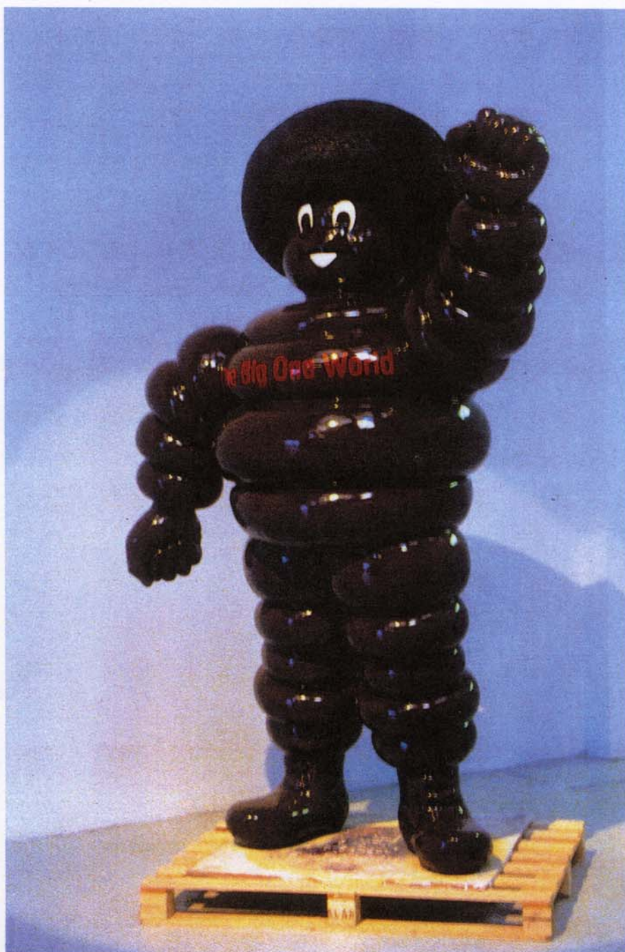
DOCUMENT 2 : Bruno PEINADO Black Bibendum, (bibendum noir), 2000. The Big One World (Un seul grand et même monde) Résine moulée, 200 cm de hauteur. FRAC Poitou-Charentes.