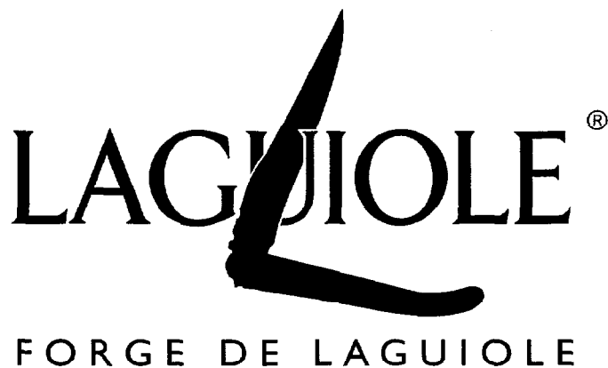
Logotype de La Forge de Laguiole