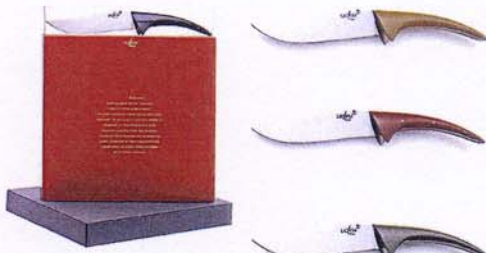
COUTEAU A FROMAGE PHILIPPE STARCK. MANCHE BAKÉLITE, NOIR, MOUTARDE, BORDEAUX, VERT cheese knife by Philippe Starck, bakelite handle, black, mustard color, claret, green.