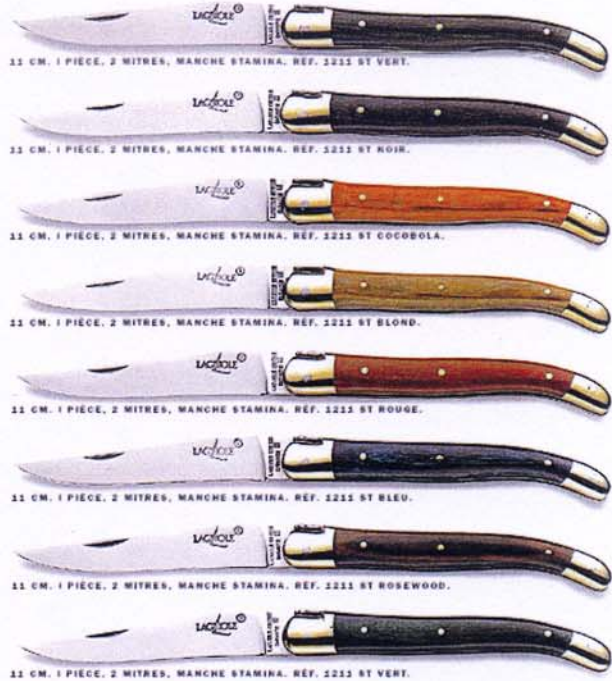
11 CM. 1 PIÈCE, 2 MITRES, MANCHE STAMINA. RÉF. 3211 ST VERT.