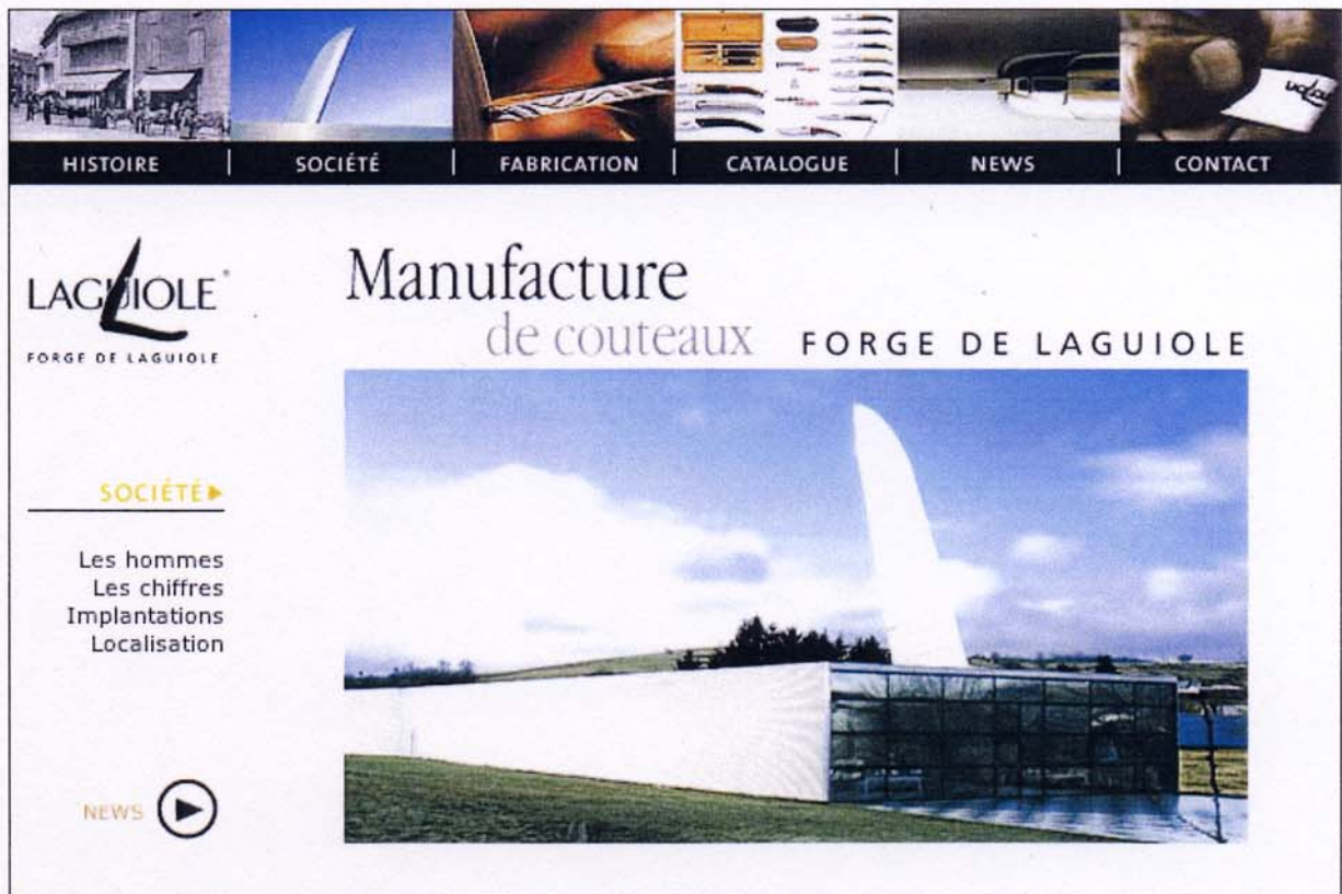
Page d'introduction au chapitre "société" du site web de Forge de Laguiole (photographie du bâtiment conçu par Philippe Starck en 1987).