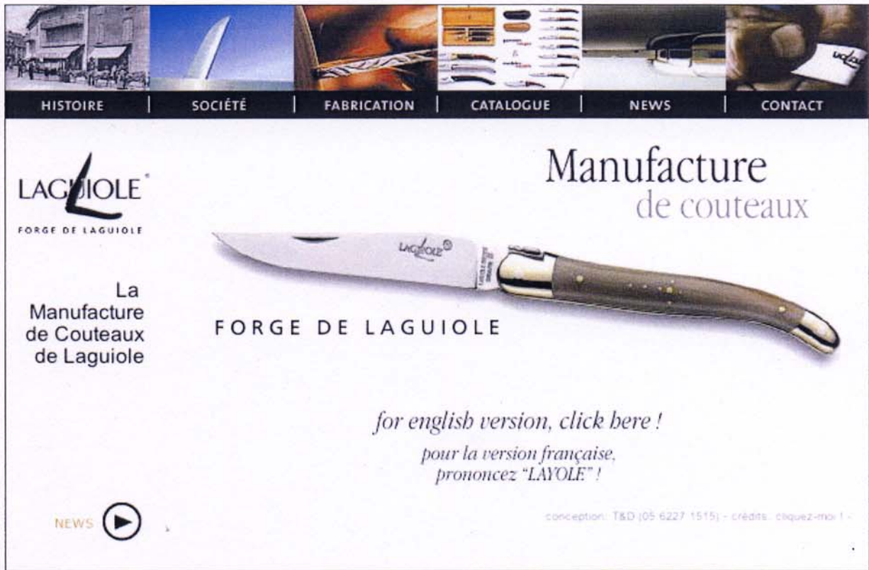
Page d'accueil du site web de Forge de Laguiole.