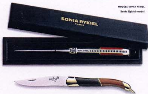
MODELE SONIA RYKIEL Sonia Rykiel model.