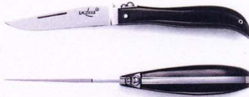
MODELE YANN PENNORS. 11 CM MANCHE POINTE DE CORNE Yann Pennor's design, 4.33 inch, horn tip handle.