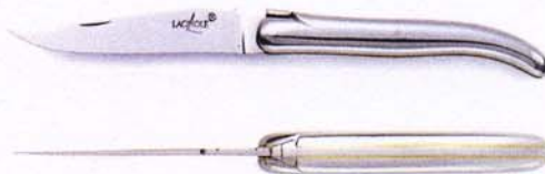
MODELE PHILIPPE STARCK. 11 CM MANCHE ALUMINIUM designed by Philippe Starck. 4.33 inch aluminium handle.