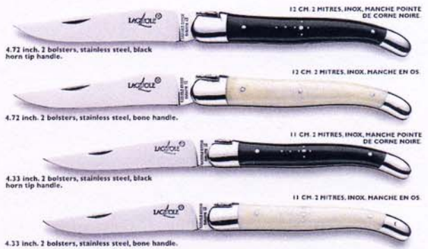
12 CM. 2 MITRES, INOX, MANCHE POINTE DE CORNE NOIRE