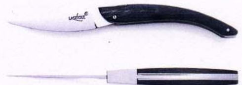
MODELE ERIC RAFFY MANCHE POINTE DE CORNE Eric Raffy design, horn tip handle.