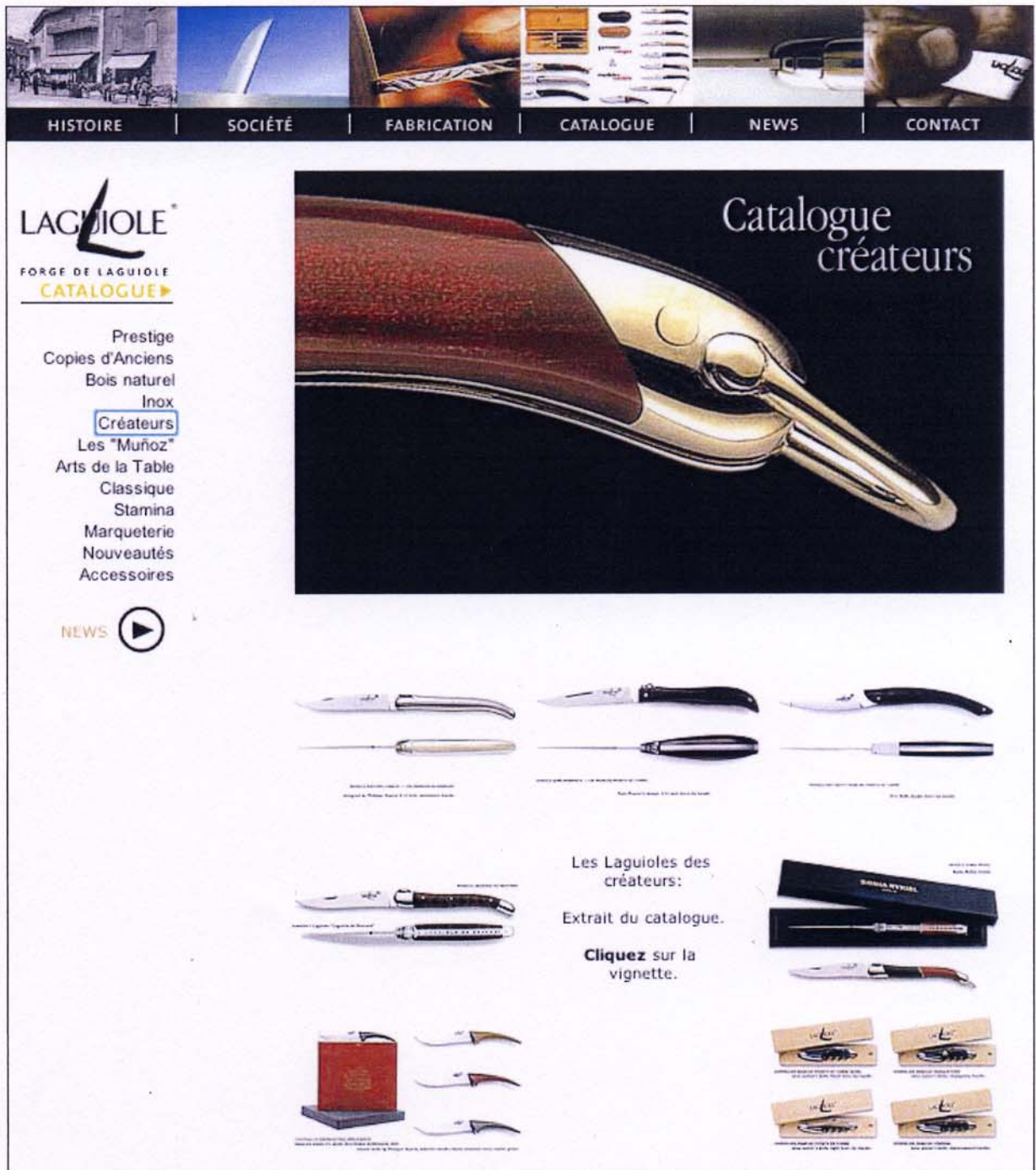
Page "Créateurs" extraite du chapitre "catalogue" du site web de Forge de Laguiole.