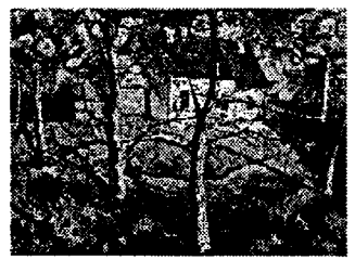
14 Camp Malevitch (1875-1908)

Le paysage, en peinture, est un genre des plus tranquilles. Le sujet choisi importe peu, l'essentiel tient à son mode de figuration. C'est précisément pour cette raison que le portrait de Claude Monet de la collection Chichouline donne une couleur à la fin du XIX e siècle. Cette quête de nouvelles formes d'expression apparaît dans les œuvres de Malevitch. Il choisit avec soin ses angles de vision, souvent inhabituels à la vue que l'on peut avoir d'une fenêtre. Des maisons apparaissent toujours derrière des arbres, dans une nature cultivée par l'homme. Ici, c'est sa campagne natale qui lui sert de modèle. Il peint