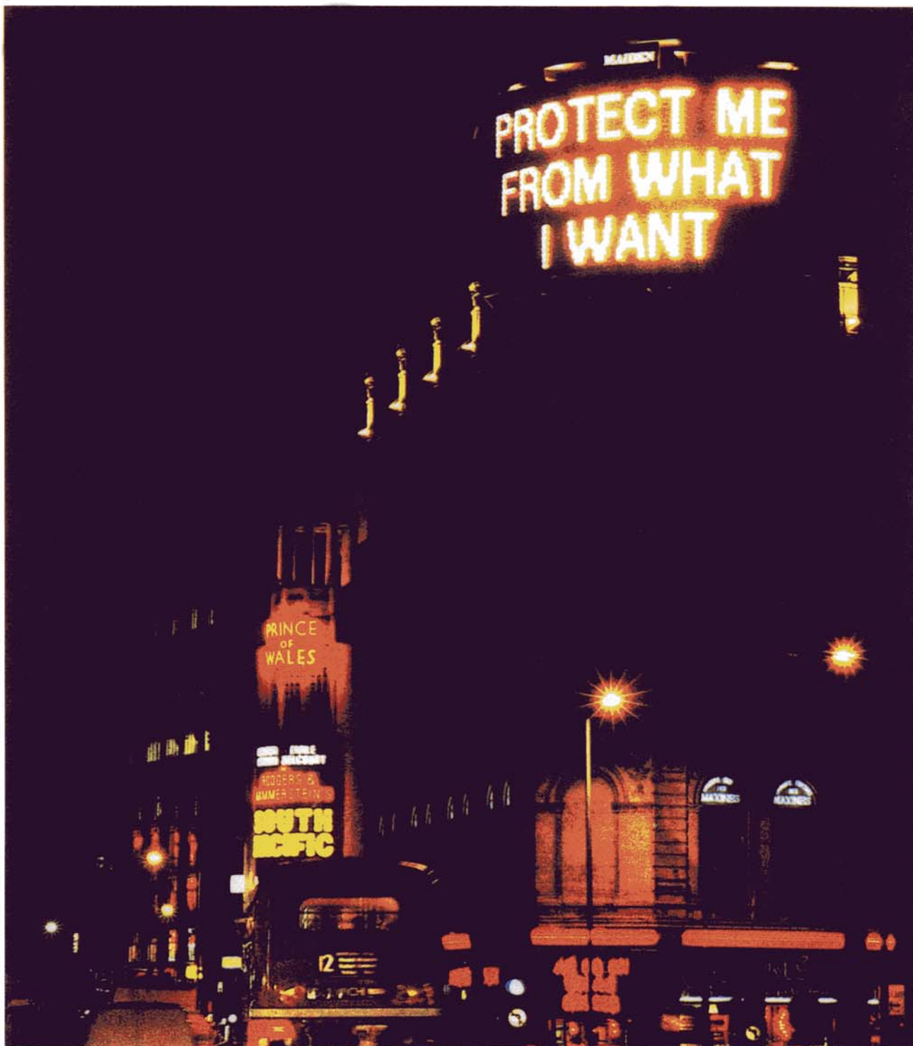
DOCUMENT 3 : Jenny HOLZER Protect Me From What I Want , 1988 ( Protégez-moi de ce que je veux ) Panneaux lumineux Picadilly Londres.