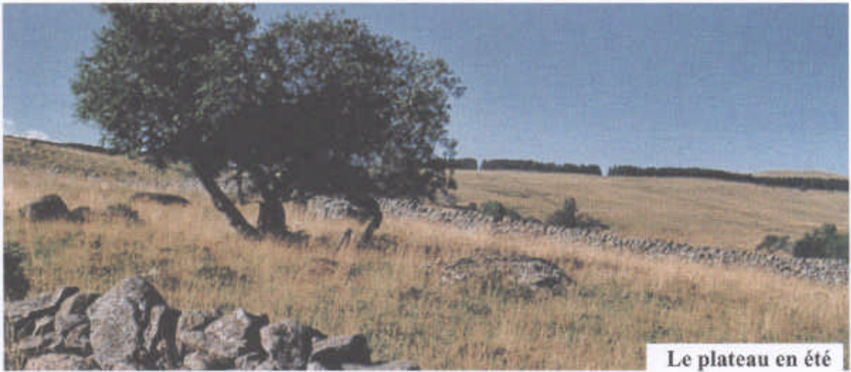
Le plateau en été