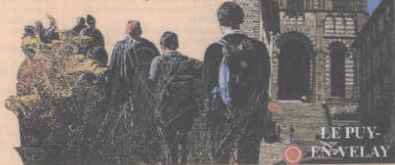
Randonneurs en Velay