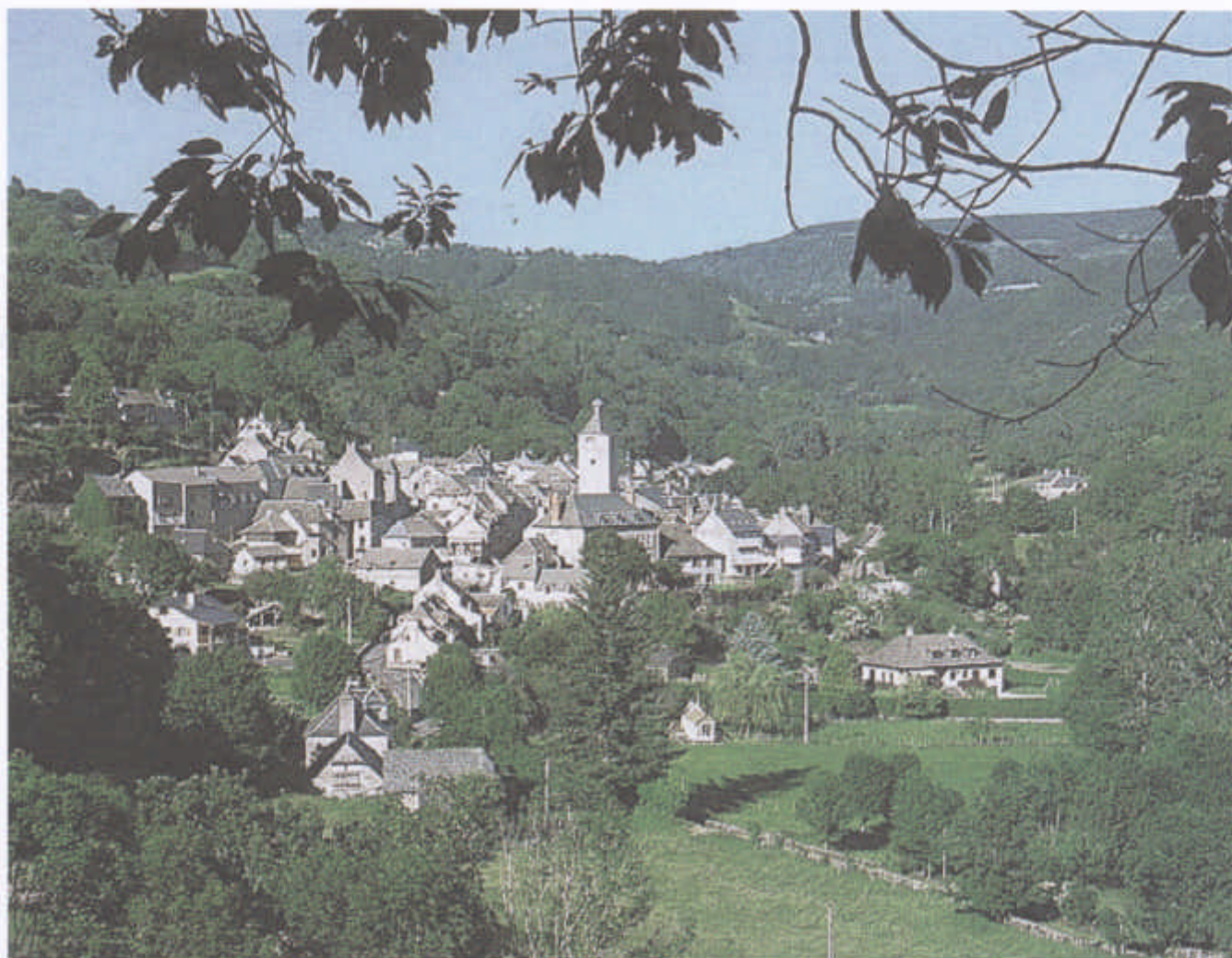
Saint-Chély-d'Aubrac, vu du sud-ouest