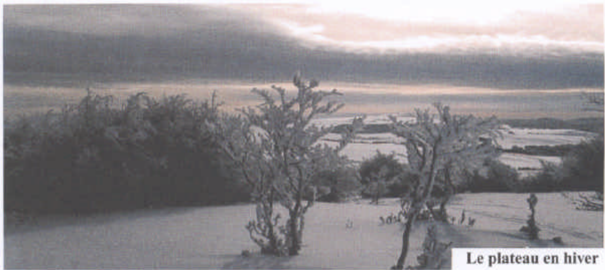
Le plateau en hiver