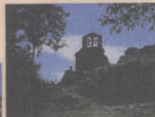
Chapelle de Rochegude