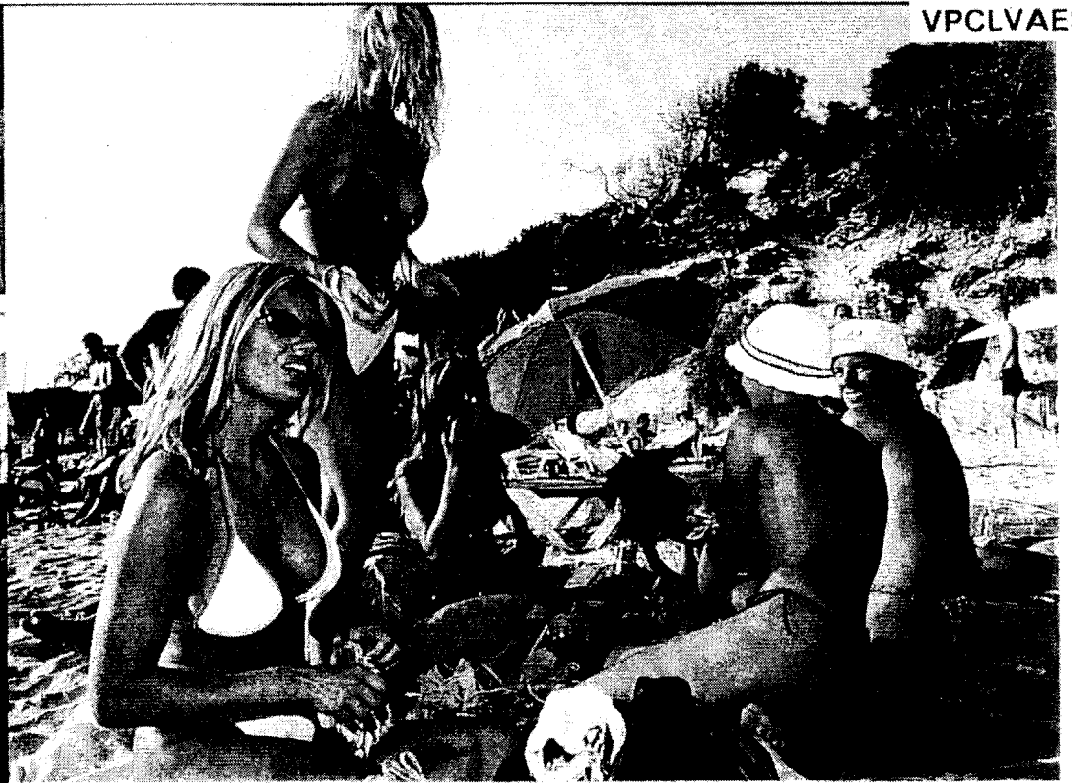
En Ibiza todo es contraste. La animación de la noche y la calma de la mañana, en las calas. La escasa ropa de las playas y los barrocos trajes regionales.