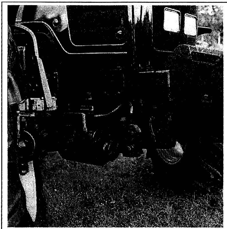
Pont avant 4 RM suspendu

Sous épreuve E22 : Préparation d'une intervention