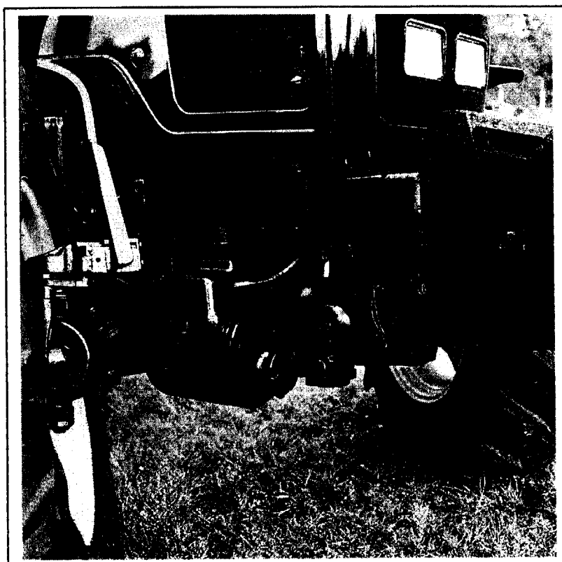
Pont avant 4 RM suspendu

☞ Le sujet est composé de deux parties :