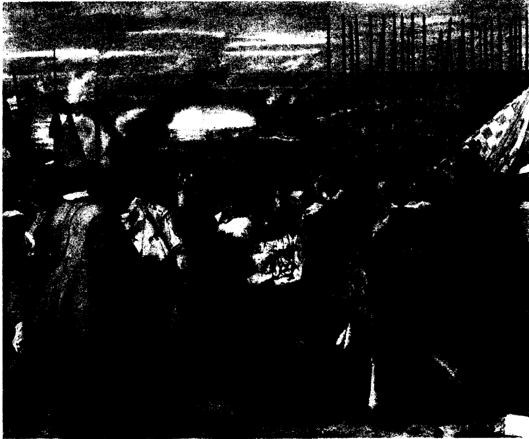
- Vélasquez. « La Reddition de Bréda ».