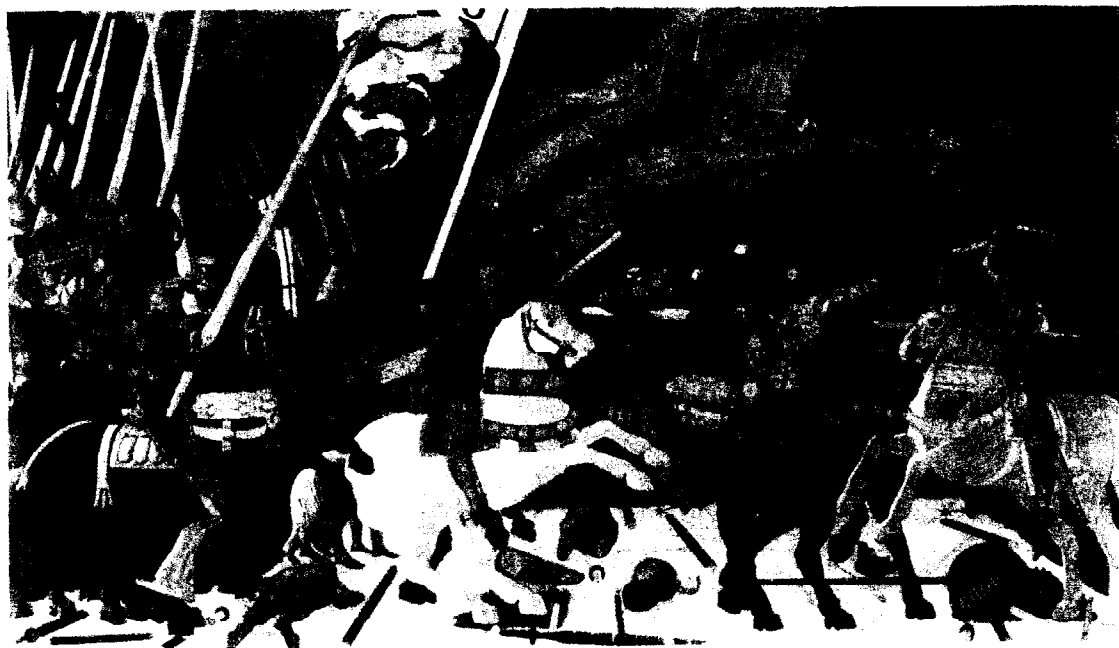
- Paolo Uccello : La Bataille de San Romano.

Chacune de ces deux oeuvres traduit l'intensité de la scène représentée. Quels moyens picturaux (visuels), ces deux artistes ont-ils utilisé pour renforcer l'idée induite par les titres mêmes des tableaux (partis de compositions, attitudes, lignes dominantes, répartition des surfaces ...).