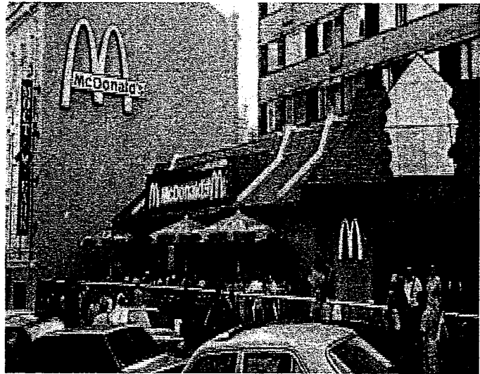
Le premier restaurant Mac Donald en Russie