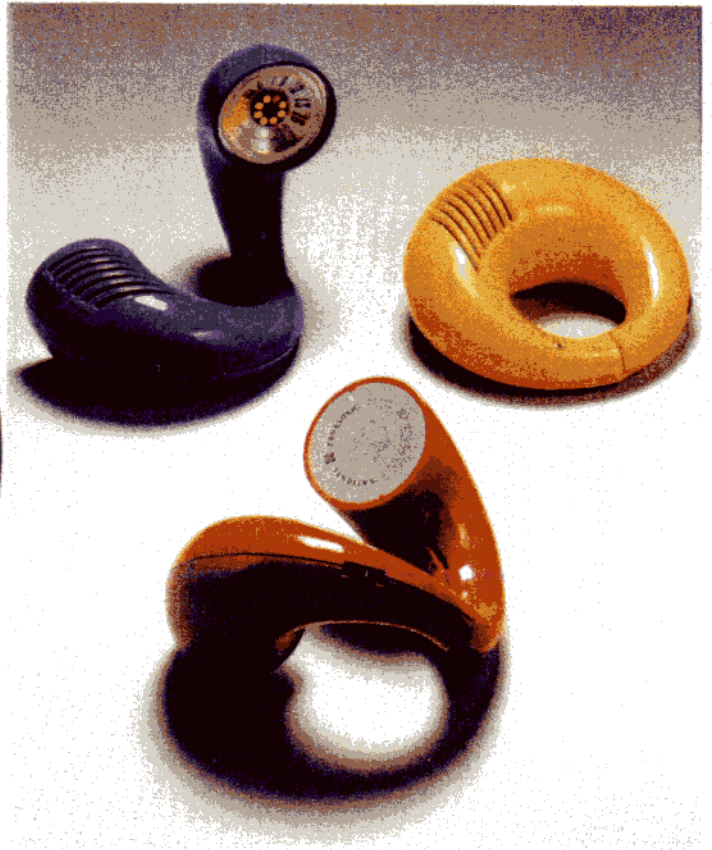
Document 2 :

Radio Ekdo AD 65, 1934 , créée par Wells COATES Bakélite, dimensions : H/L 38 x P 20 cm.