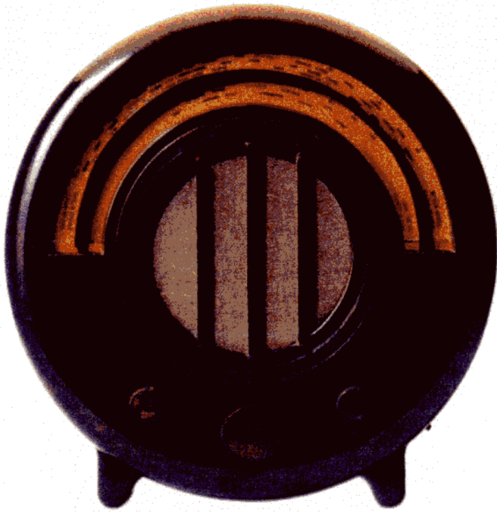
Document 1 :

Radio Ekdo AD 65, 1934 , créée par Wells COATES Bakélite, dimensions : H/L 38 x P 20 cm.