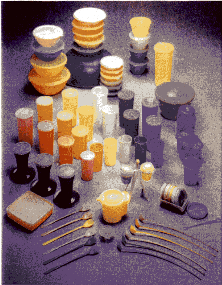
Document 4 : Collection Tupperware, années 50, USA.