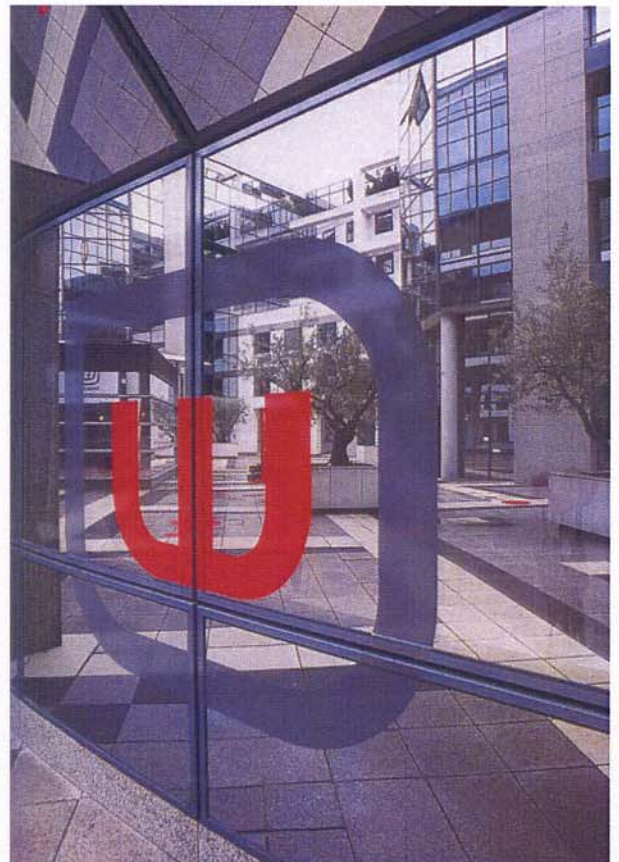
Documents 2, 3, 4 et 5 : Vues de l'aménagement du siège social de Wanadoo réalisé en 2002.