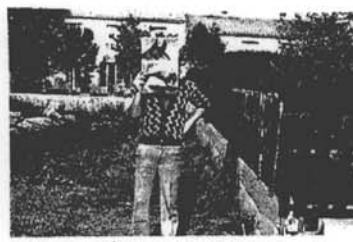
3 Il y a un cheval au bord de la route