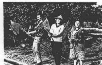
5. Un groupe de camions passe.