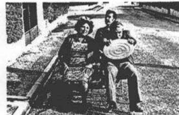
6 Une voiture.