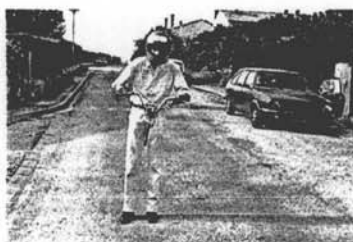
1. J'adore faire de la mobylette.