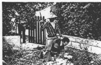
4. On trouve un "Western spaghetti" dans la fonction.