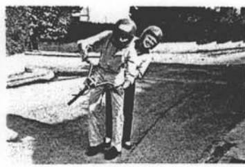
2. Je transpire ma cousine Elli a peu des images.