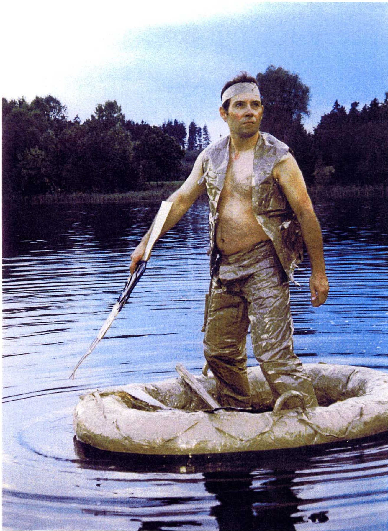
DOCUMENT 2 : Olivier BLANCKART Action Art-pocalypse now , 1995 Autoportrait dirigé. Collection privée.