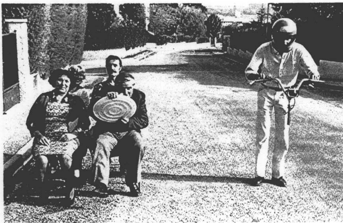
7. Je la dépasse car je suis pressé!