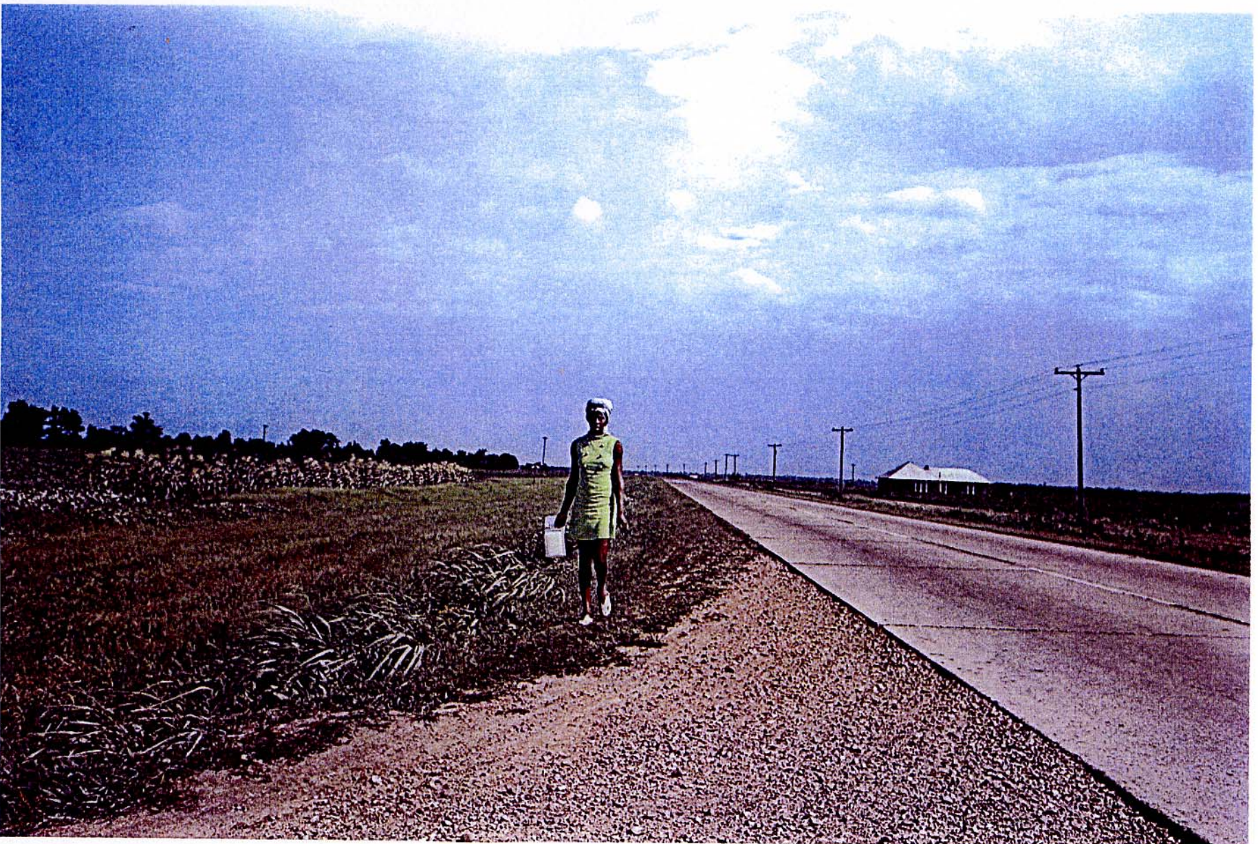
William Eggleston, sans titre (near Glendora, Mississippi), c. 1970