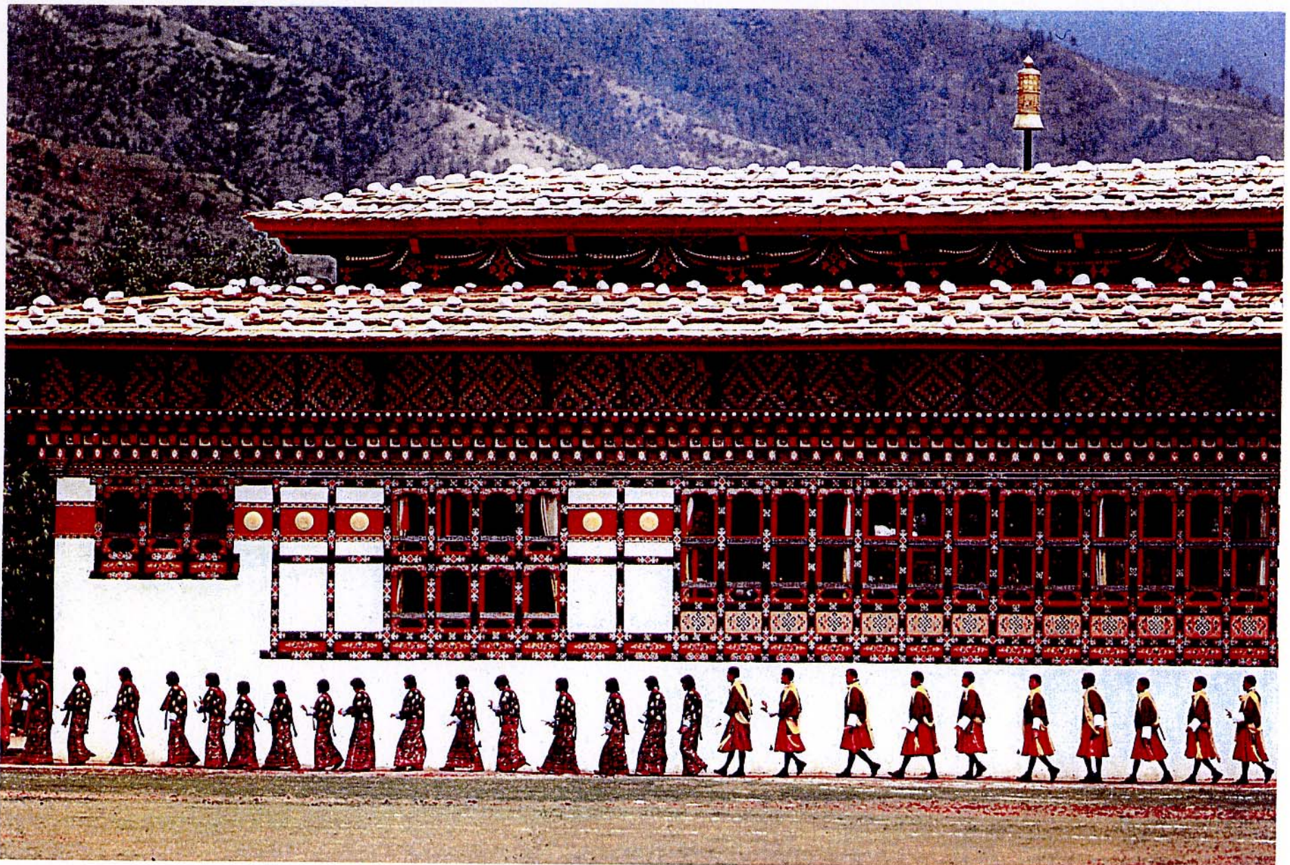
Ernst Haas : Procession-Jour du Couronnement , Bouthan, 1974