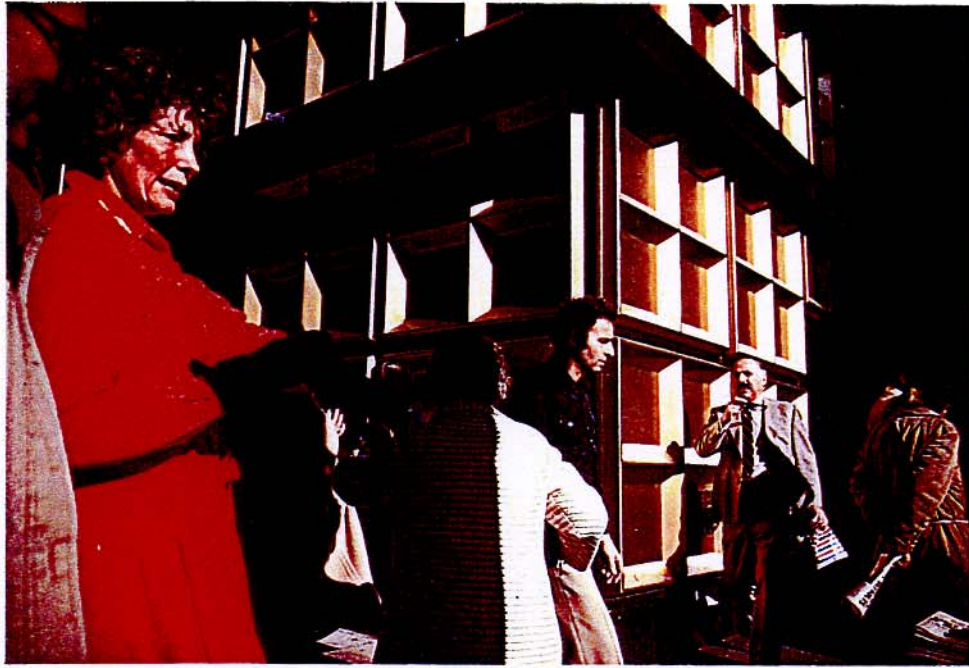
Joel Meyerowitz: New York , 1975