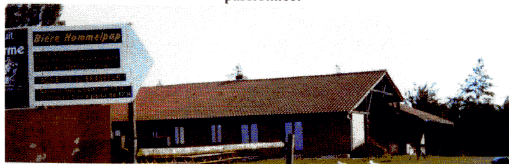
Le nouveau gîte de groupe de la ferme-brasserie