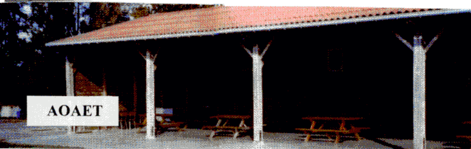
L'aire de pique nique de la ferme-brasserie