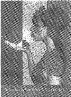
Quatrième de couverture

La publicité de l'enseigne Monoprix en quatrième de couverture ( Page 11/16 Annexe 2 ) a été réalisée à partir de trois ektachromes distincts numérisés avec un facteur d'agrandissement de 6 fois. Compte tenu des caractéristiques du support d'impression à quelle résolution a-t-il fallu numériser ces images ? ( Précisez les paramètres que vous prenez en compte dans votre calcul )