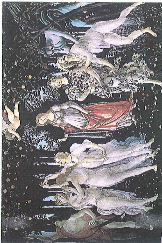
Sandro BOTTICELLI Le Printemps, v. 1477-1478 Bois, 203 x 314 cm Florence, musée des Offices