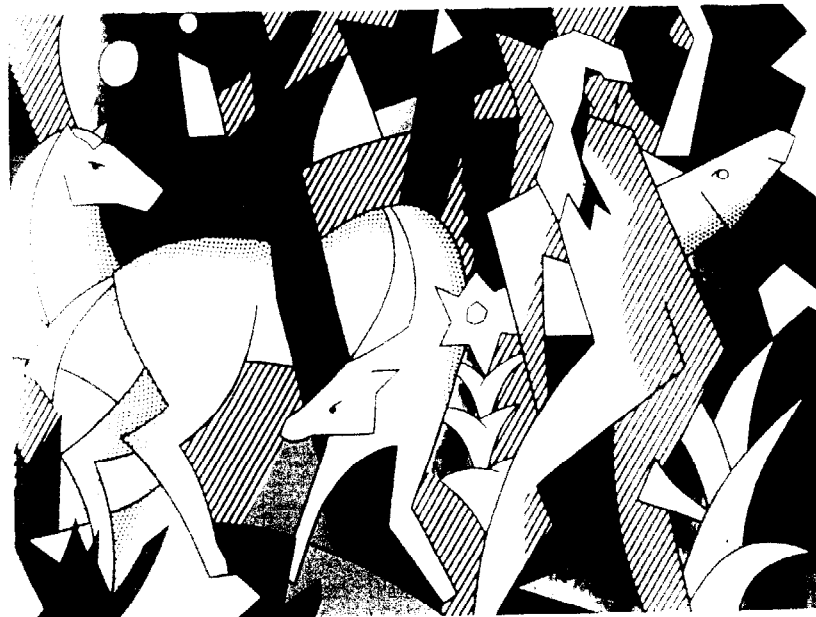
SCENE DE FORET, 1980 ROY LICHENSTEIN