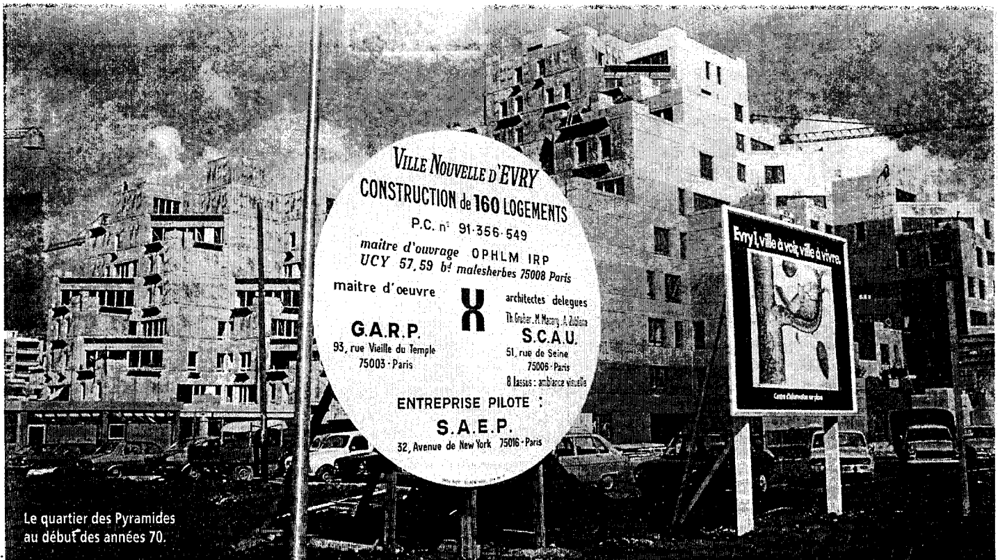
Le quartier des Pyramides au début des années 70.