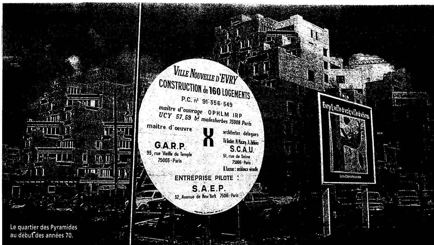
Le quartier des Pyramides au début des années 70.