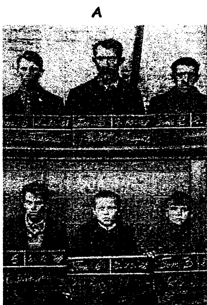
Photographie d'embauche dans les années 1920 dans les mines (centre historique minier du Nord-Pas de Calais à LEWARD)