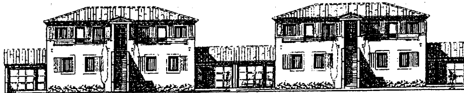
FACADE SUR ENTREES