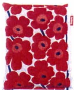
fatboy the original Marimekko Unikko Red