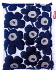
fatboy the original Marimekko Unikko Black