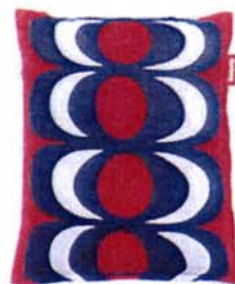
fatboy the original Marimekko Kaivo Red

vul het gewenste aantal Fatboy kussens in bij de betreffende kleur