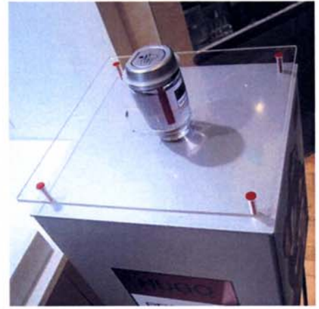
fontaine à parfum