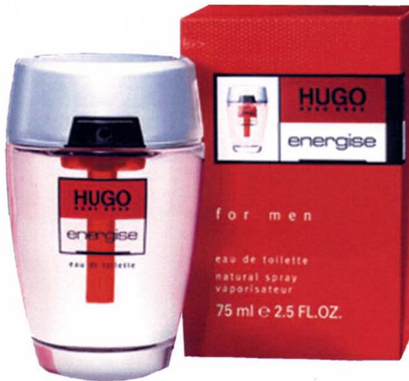
packaging et flacon