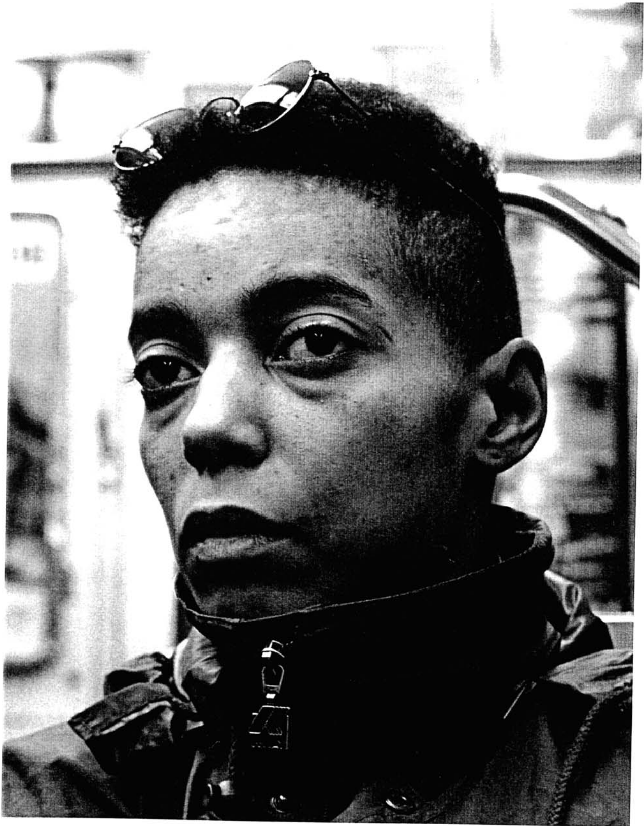
Luc Delahaye, de la série L'Autre , 1997. Tirage noir et blanc, 150 x 120 cm