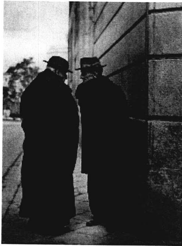
Brassai (Gyula Halasz) Seville 1952-53