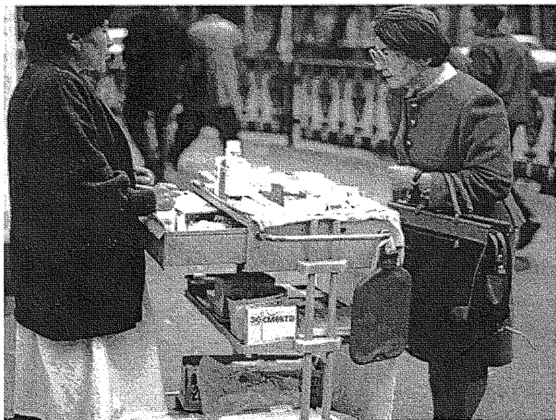
Médicaments sur un étal à Tachkent en Ouzbékistan pays situé au nord de l'Afghanistan (voir document 3) -1999 documentation française n°8015 juin 2000