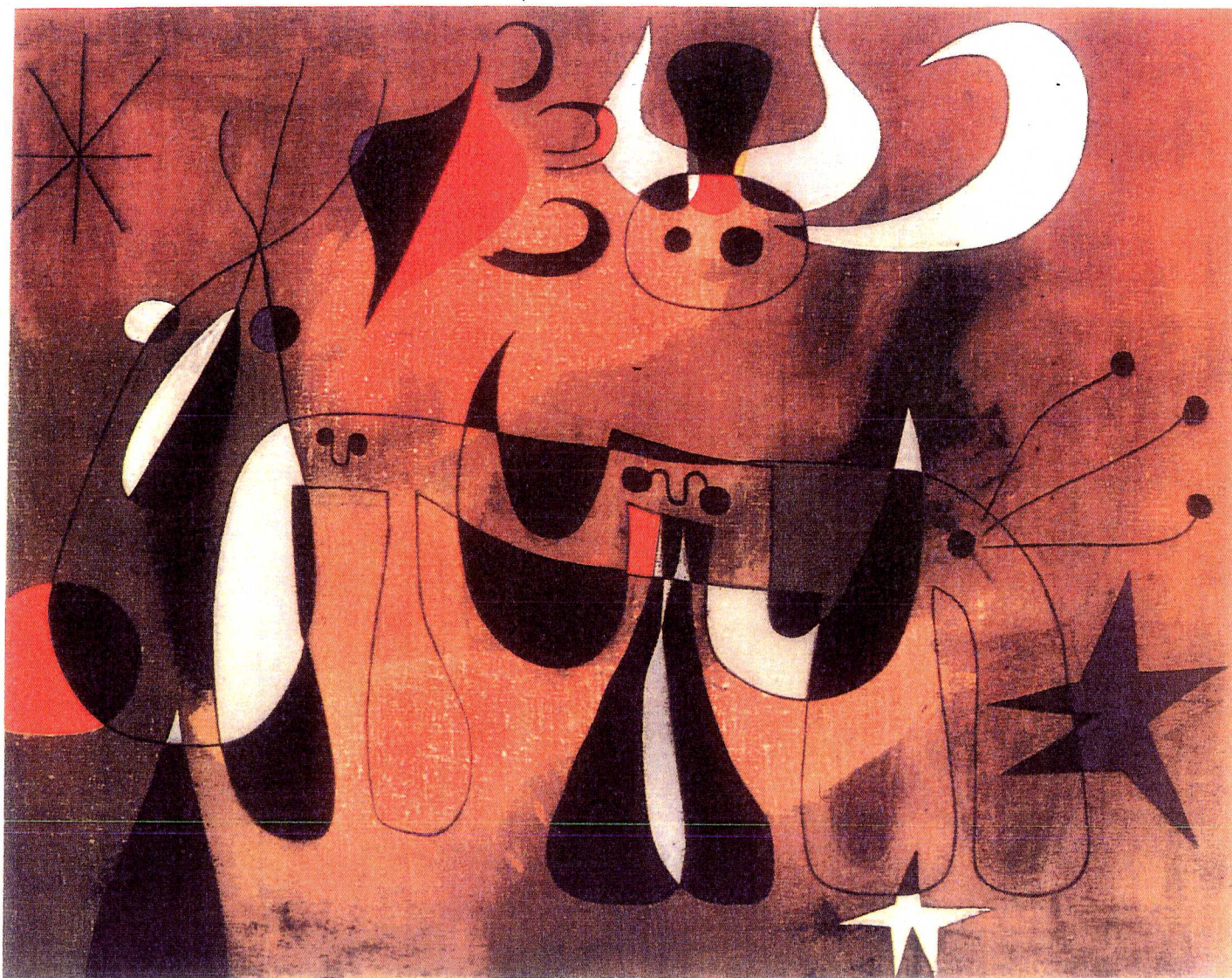
Joan Miró, Personnages dans la nuit , 1950. Huile sur toile.