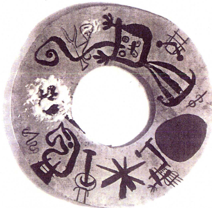
Joan Miró, Antiplats , 1956. Céramique, Ø 50 cm.

BEP/CAP Alimentation dominante charcutier traiteur Epreuve : ARTS APPLIQUES